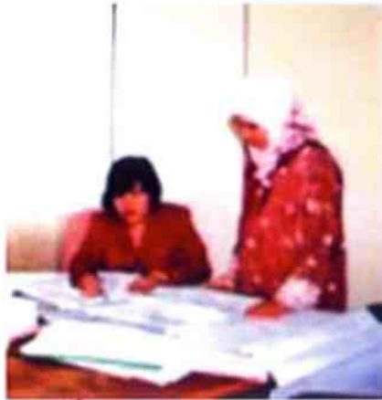
Proses menyemak pelan bangunan oleh pegawai-pegawai di Jabatan Bangunan

Menukar kegunaan bangunan daripada kediaman kepada aktiviti-aktiviti lain seperti perniagaan, pendidikan dan sebagainya perlu mendapatkan 'Kebebasan Merancang' terlebih dahulu daripada Majlis Perbandaran Pulau Pinang dengan membuat permohonan kepada Jabatan Bangunan, Tingkat 14, KOMTAR, Pulau Pinang.