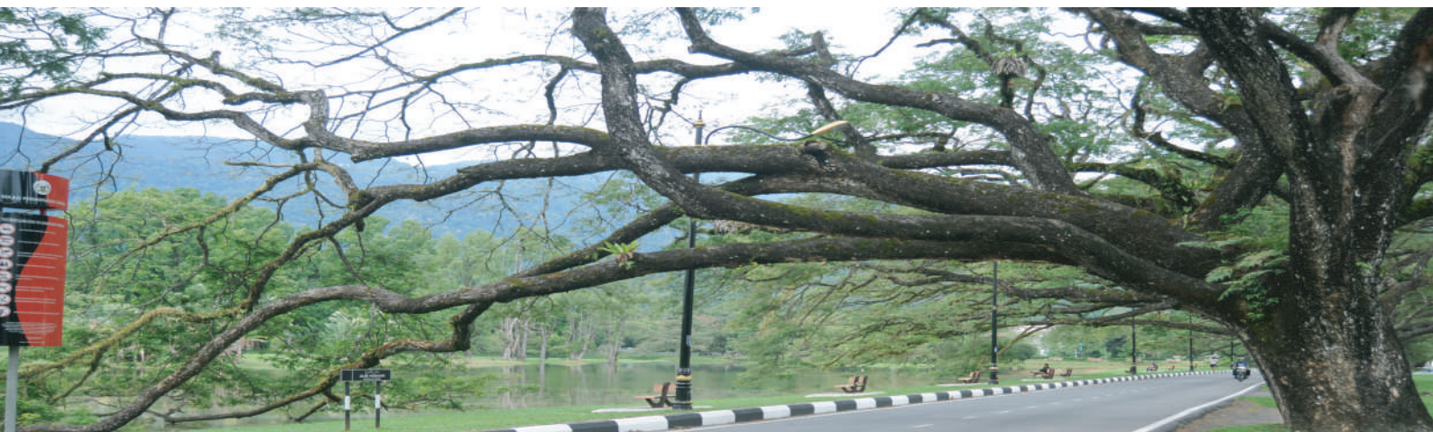
Taman Tasik Taiping, Perak