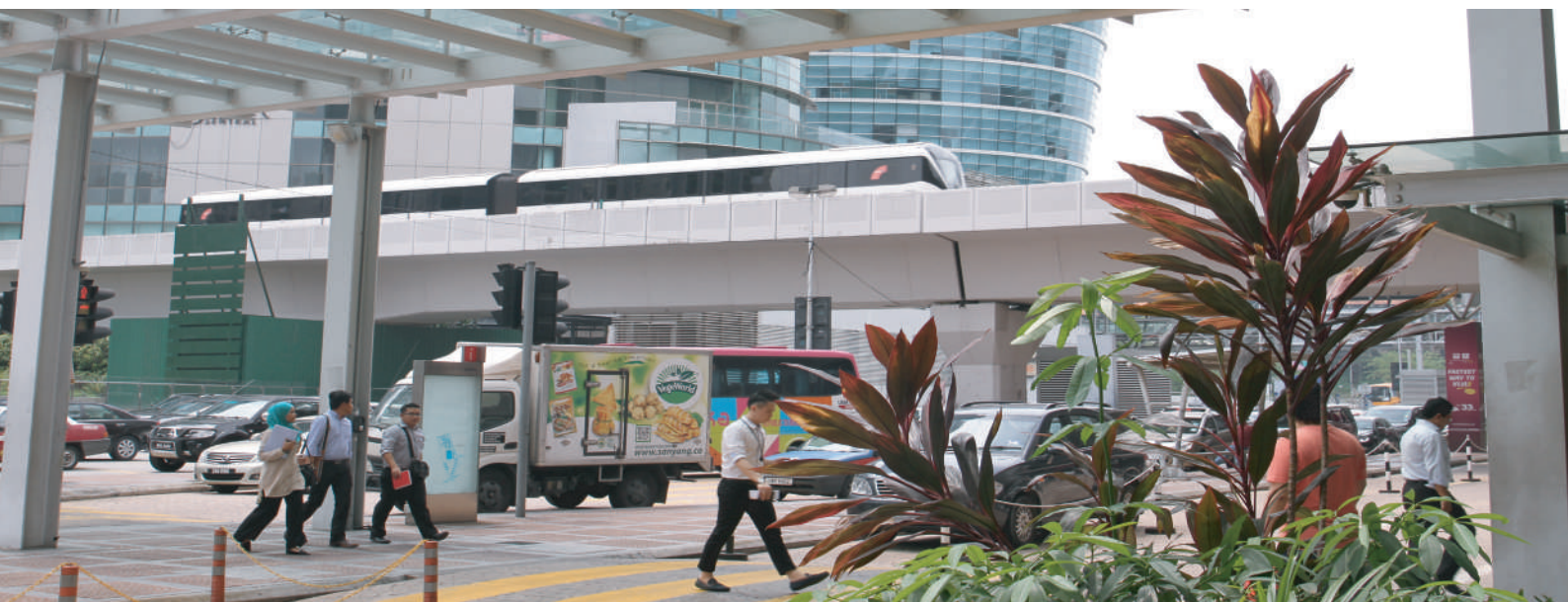
KL Sentral, Kuala Lumpur

Mampan dalam DPN2 meliputi aspek fizikal, alam sekitar, sosial dan juga ekonomi. Bandar Mampan yang dimaksudkan ialah pembangunan fizikal sesebuah bandar yang dilaksanakan secara optimum berdasarkan kepada keperluan penduduknya tanpa mengabaikan aspek kawalan alam sekitar yang mana faedah dari pembangunan dan perkembangan ekonomi bandar tersebut dapat dirasakan oleh semua golongan masyarakat termasuk golongan kanak-kanak, golongan belia, warga emas dan juga orang kurang upaya (OKU) yang hidup dalam suasana yang harmoni dan bersatu padu.